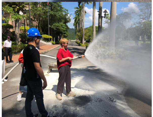
《112 年下半年度自衛消防編組演練暨國家防災日地震避難掩護訓練情形》

二、112 年建築物公共安全檢查申報之大樓為：商管一館、行政大樓、商管二館、圖資